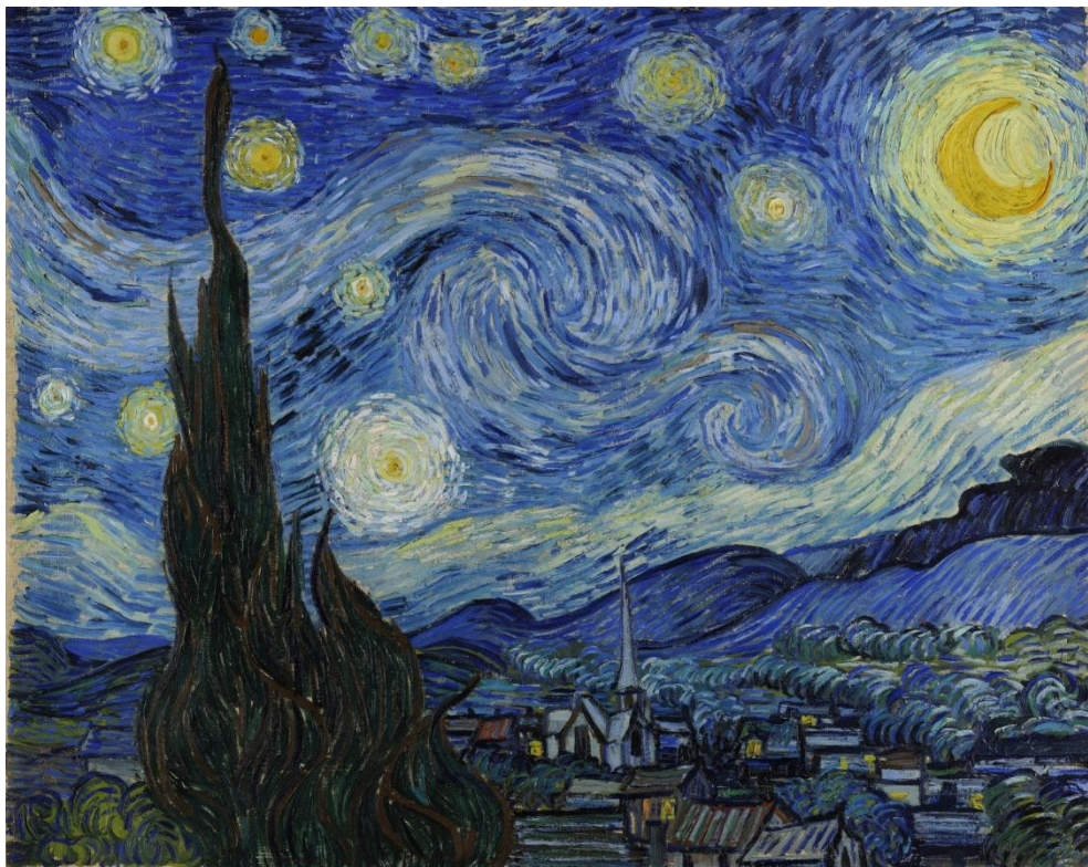
Vincent van Gogh La notte stellata 1889