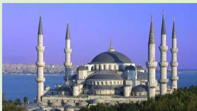
Estambul, Mezquita Azul

“La seductora Estambul os regala las mejores vacaciones baratas de verano”.