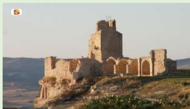
Valledoria, castillo Doria