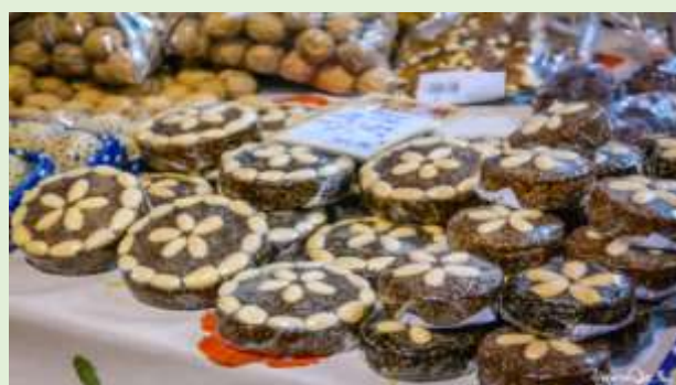
Faro, dulces “Dom Rodrigo”