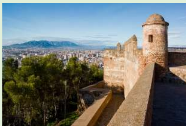
Malaga, castillo Gibralfaro