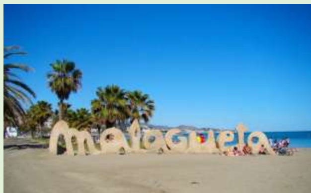
Malaga, playa de Malagueta

Primer lugar es Málaga : sexta ciudad más poblada de España, la segunda de Andalucía y la número cuarenta y seis de la Unión Europea. Es la ciudad costera más grande y poblada del sur de España y os gustará mucho no solamente por su buen clima (los veranos son calurosos) sino por todo lo que os ofrece la Costa del Sol. Tendréis la posibilidad de encontrar habitaciones dobles desde 20 euros por noche y a partir de ahí podréis destinar vuestro presupuesto a disfrutar de sus maravillosas playas (como por ejemplo San Julián, Malagueta), de sus museos como el de Picasso, del castillo de Gibralfaro, de su rica gastronomía (estando cerca del mar, el pescado es típico sobre todo en verano pero muy buena es también la “torta loca” elaborada con hojaldre, crema pastelera, un glaseado de yema y decorada con guindas) y la amabilidad de los malagueños.