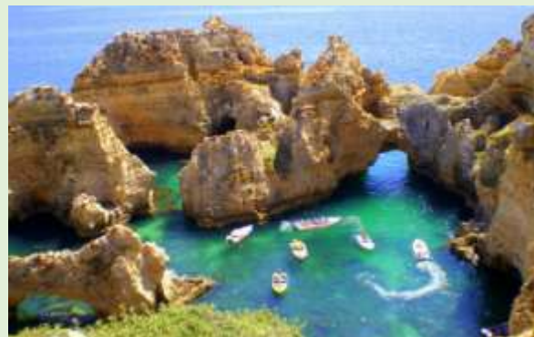
Faro, punta de la piedad

La ciudad de Faro cuenta con un casco antiguo realmente deslumbrante que está rodeado por las antiguas murallas arabs de la población. En el centro del casco antiguo se encuentra la Catedral Sé, la cual permite unas vistas absolutamente maravillosas de la ciudad y del Parque Natural de la Ria Formosa.