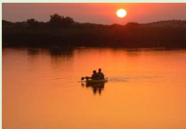
Valledoria, río Coghinas

En Valledoria podréis encontrar algunos restaurantes o bares baratos donde podréis comer platos típicos a base de pescado como por ejemplo “pasta coi ricci” pero también “gnocchetti sardi” (una tipología de pasta con carne) o “i ravioli” (pasta con carne y queso) y como dulces podréis comer “le seadas” (pasteles rellenos de queso y cobiertos de miel) pero también “le formaggelle” (un pastel relleno de queso).