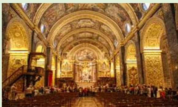
Malta, catedral de san John

Y para terminar os proponemos Malta . Aunque su clima hace que este archipiélago sea el lugar ideal para descansar durante todo el año, es en verano que podréis disfrutar de las playas de Anchor Bay o Golden Bay. De hecho en verano el clima es único con temperaturas hasta 34° C en verano (julio y agosto).