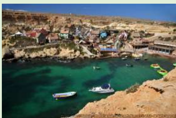
Malta, Anchor Bay